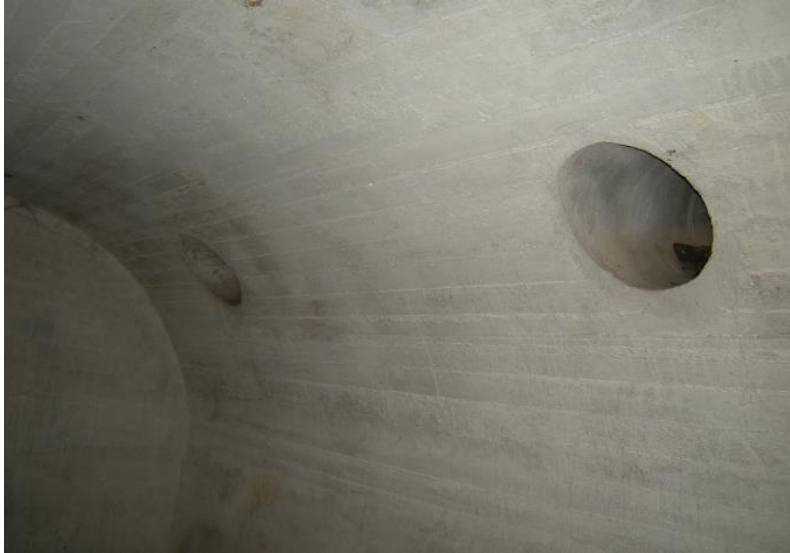
Respiraderos en las bóvedas.

El techo de esta nave es la segunda parte del conjunto que se observa en la actualidad desde el exterior, manteniendo la técnica del encofrado de hormigón armado. Los respiraderos exteriores tienen un diámetro de 40 cm.