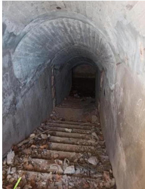
Tramo de escalera de bajada

Al exterior aflora una de las dos partes visibles del conjunto. Se trata del casetón de la escalera que posee una longitud de 9,38 m y una anchura de 3,88m. Consta de cuatro tramos escalonados. Se construye mediante la técnica del encofrado de hormigón de cemento armado con varillas lisas. En el lado oeste se marca la huella de unión en talud del adosamiento de las cajas entre el primero y segundo tramo escalonado. Las paredes exteriores conservan parte del revestimiento de cemento correspondiente al cuerpo construido sobre él durante el periodo de uso del Parque.