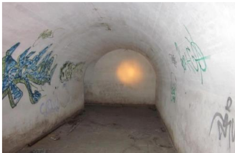
Tramo entre escalera y nave central.

D. Nave central. El tercer pasillo desemboca en la nave central de planta cuadrada de cerca de 11 m de lado. Se divide en tres naves mediante gruesos muros de 1,05 m de espesor. Como los pasillos en zigzag, estos muros que compartimentan la sala tienen la función de parapeto en caso de deflagración al interior del refugio. En el lado este se sitúa una larga pila y en el sur una nueva hornacina.