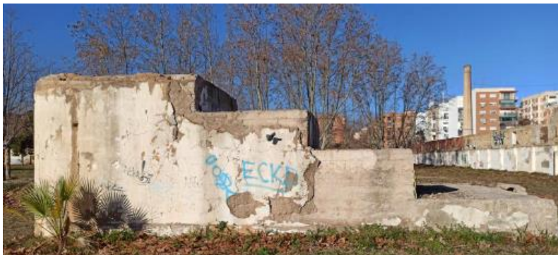
Casetón de la escalera.

Al exterior aflora una de las dos partes visibles del conjunto. Se trata del casetón de la escalera que posee una longitud de 9,38 m y una anchura de 3,88m. Consta de cuatro tramos escalonados. Se construye mediante la técnica del encofrado de hormigón de cemento armado con varillas lisas. En el lado oeste se marca la huella de unión en talud del adosamiento de las cajas entre el primero y segundo tramo escalonado. Las paredes exteriores conservan parte del revestimiento de cemento correspondiente al cuerpo construido sobre él durante el periodo de uso del Parque.