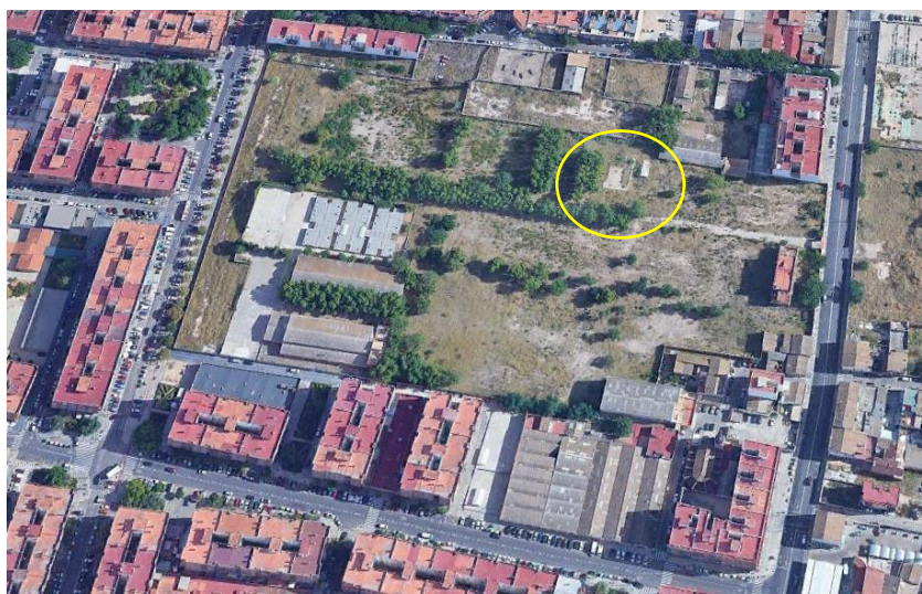
Localización del refugio de la Guerra Civil.

El recinto ocupado por el refugio se encuentra incluido en el ámbito Unidad de Ejecución A.4-3 "Parque y Maestranza de Artillería" por lo que es necesaria su integración en la ordenación del ámbito teniendo en cuenta sus especiales características como elemento protegido.