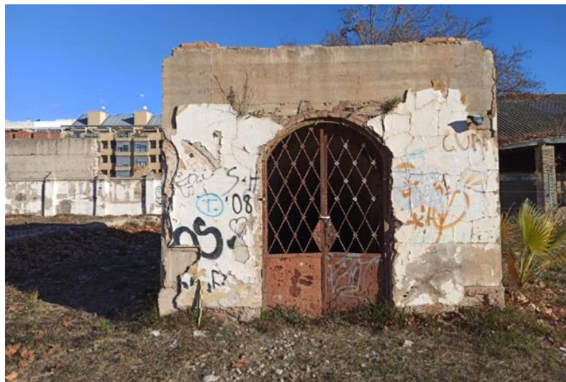
Puerta de acceso al refugio

A. Puerta de entrada principal con cierre de verja metálica. El vano forma un arco de medio punto conformado por una rosca de ladrillos macizos a tizón en el intradós, mientras que las jambas y extradós presenta ladrillos huecos. Es posible que la colocación de estos ladrillos rompa o afecte parcialmente a la fábrica de encofrado de hormigón de la caja de la escalera, por lo que opinamos que esta puerta se repuso en un momento posterior.