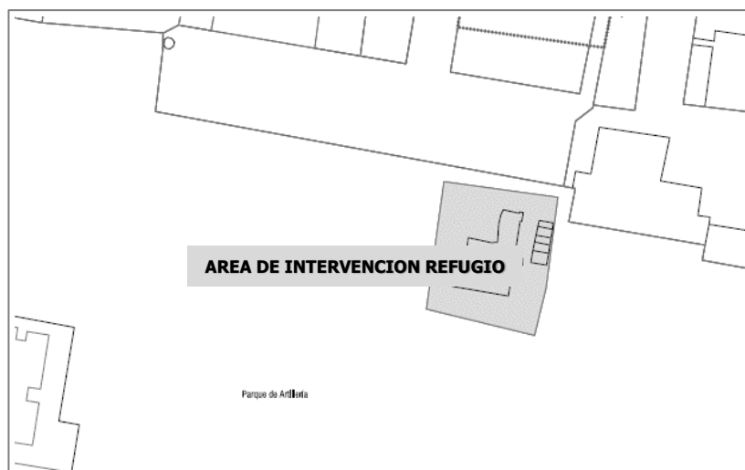
Delimitación del área de actuación del proyecto de intervención.

El refugio de la Guerra Civil se localiza en las coordenadas X: 725009-Y: 4370252. Al mismo se accede por una escalera orientada sur/norte, con bóveda de medio punto de hormigón. Al final de la escalera, la galería marca un vértice de 90º y gira hacia el oeste, ya en un tramo de piso plano, sin inclinación. Tras un recorrido de aproximadamente otros 30 metros la estructura marca un nuevo vértice, llegando a la nave central, de planta cuadrada. La planta registrada es la típica de estas estructuras, con cambios bruscos de orientación (giros en codo) para mitigar los efectos de las ondas expansivas en caso de explosiones. Como todo refugio antiaéreo cuenta con un segundo acceso secundario, formado por tres pequeños tramos en zigzag en rampa y un tramo de escaleras.