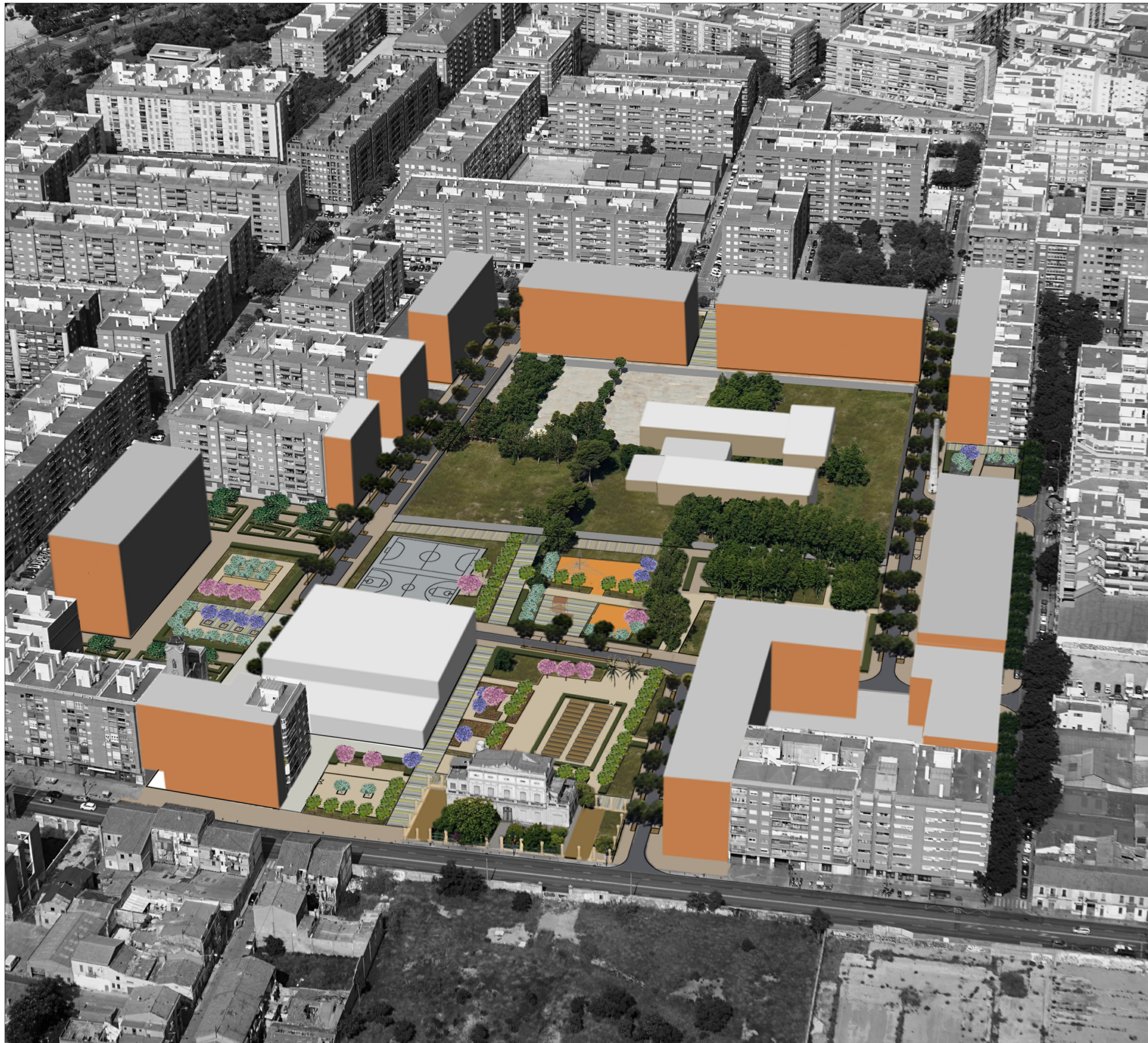
Vista aérea de la actuación desde el lateral de la calle San Vicente Mártir