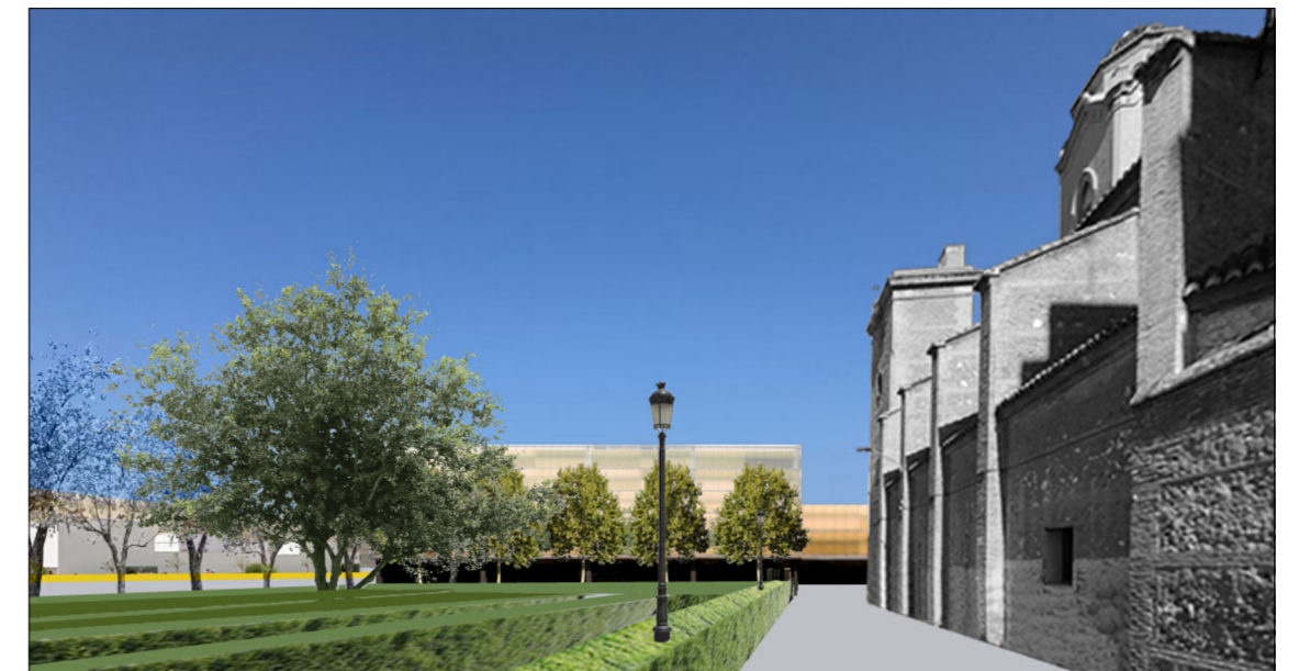
Vista de acceso peatonal junto a la Iglesia desde la Avenida del Primero de Mayo