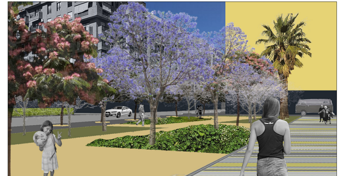
Vista de la calle Carteros desde el jardín logitudinal contiguo