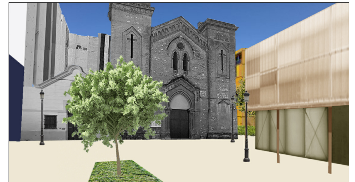
Vista del viario peatonal de acceso a la Iglesia del Santísimo Cristo de la Providencia