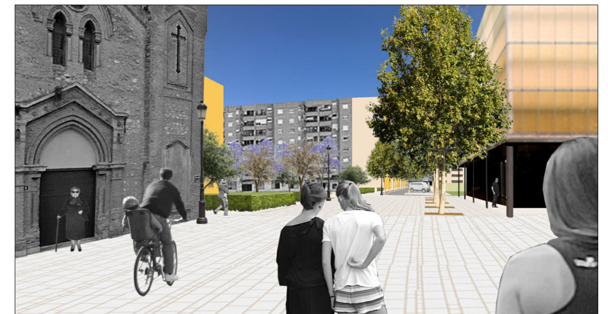
Vista interior desde la Plaza del Vicario Ferrer