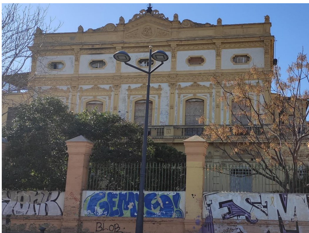
Foto 4. Fachada edificio.