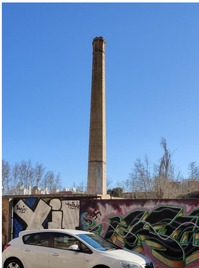
Foto 3. Vista general del elemento a proteger.