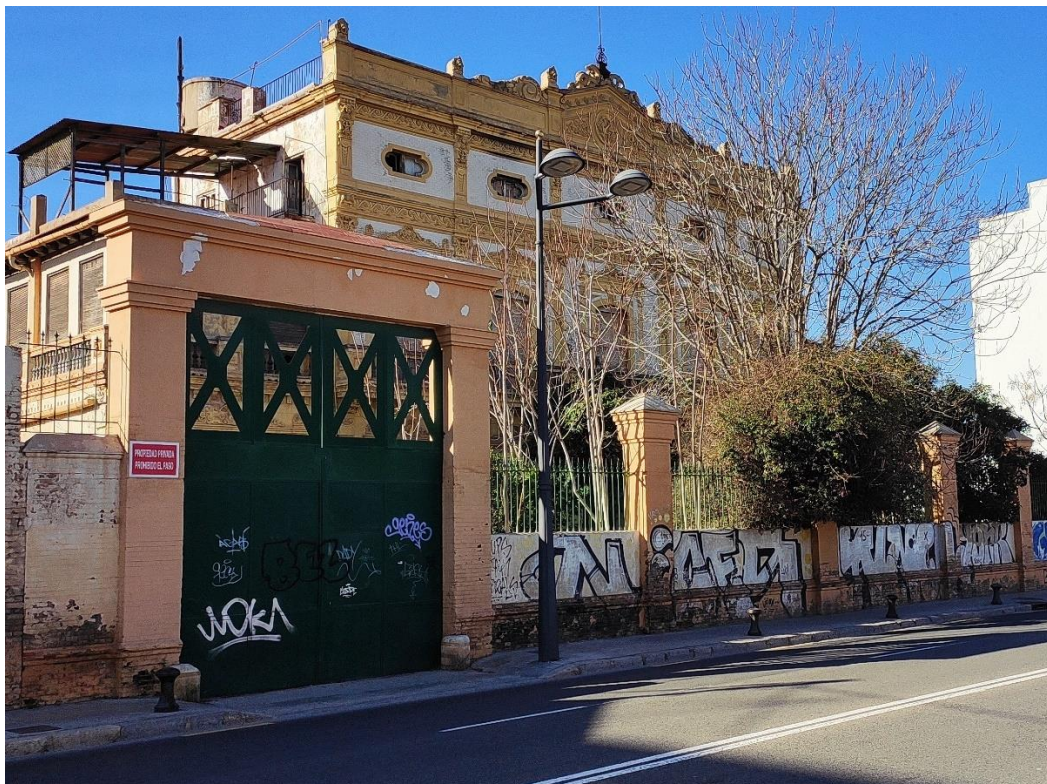
Foto 6. Entrada lateral y fachada edificio