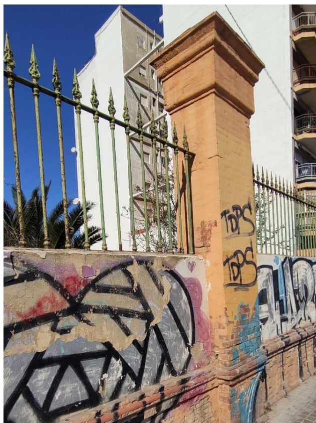
Foto 12. Detalle de la verja de cerrajería.