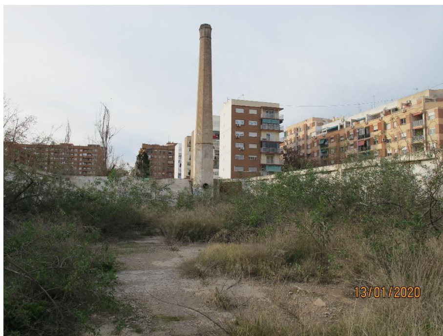
Foto 1. Vista del solar con la chimenea al fondo.