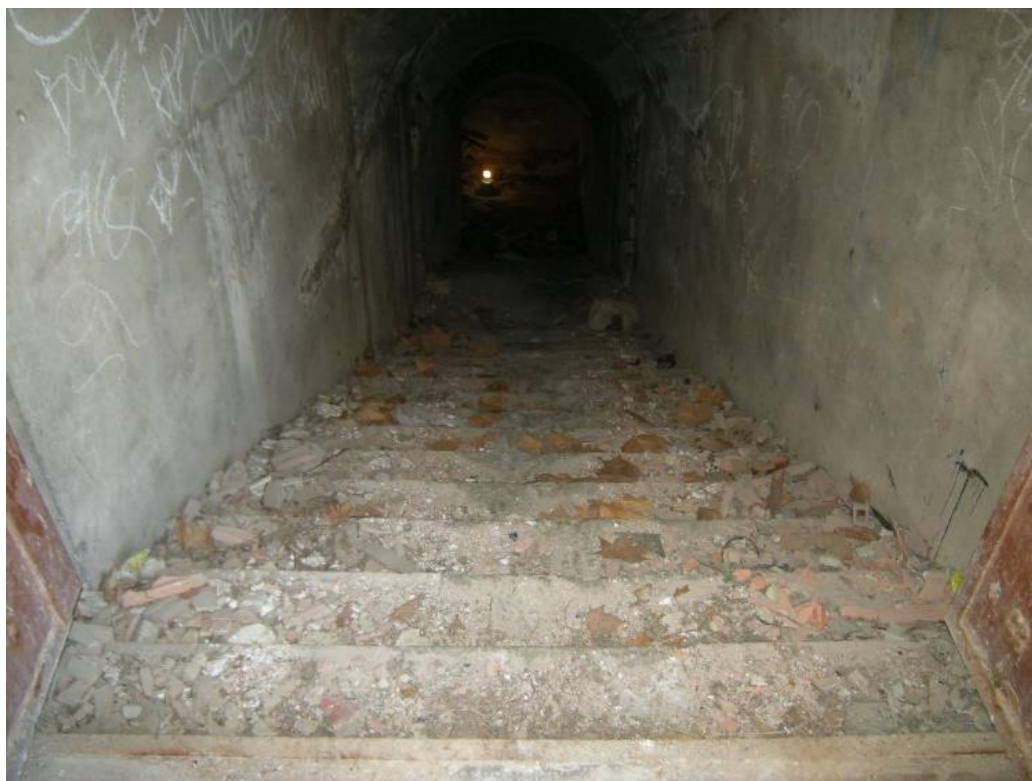
Foto 15. Escalera de acceso al nivel inferior del refugio antiaéreo.