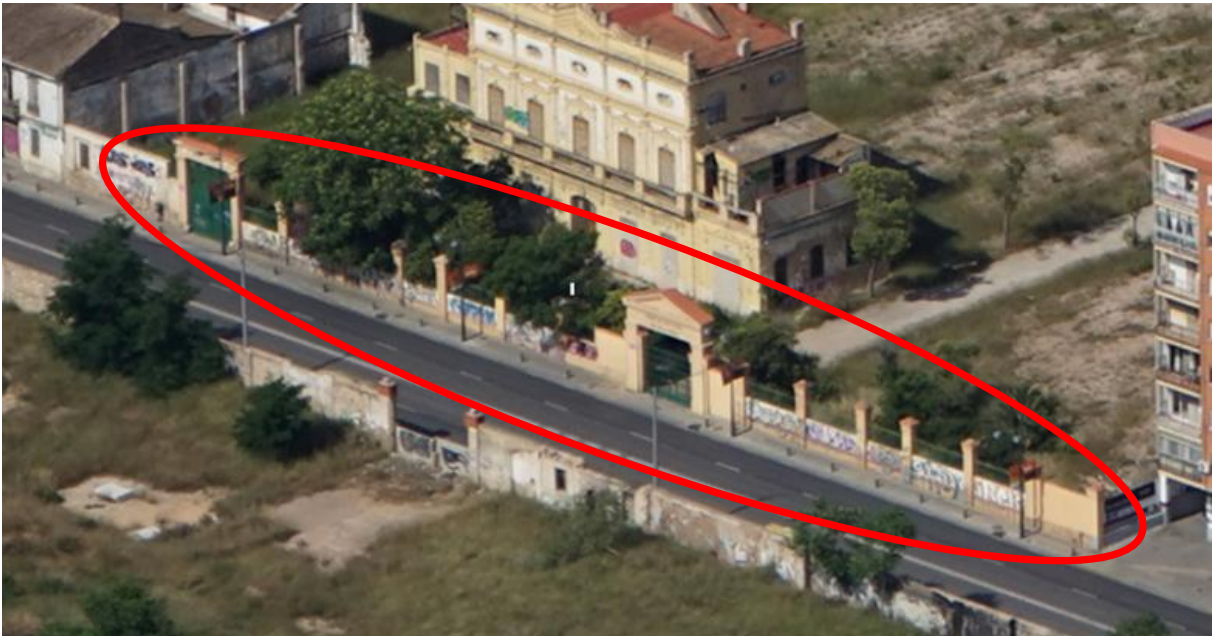
Foto 9. Vista general muro con verja a conservar del antiguo Cuartel de Artillería.

A efectos de este proyecto se conservará el muro de fábrica con verja de cerrajería en la acera de la calle San Vicente Mártir, así como las puertas de acceso a la antigua instalación del cuartel de Artillería.