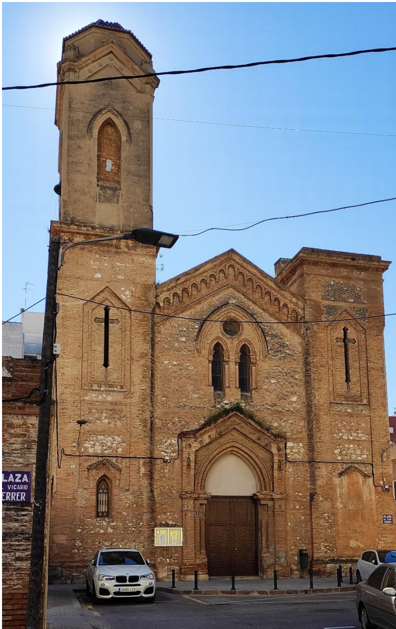
Foto 17. Fachada principal de la Iglesia del Cristo de la providencia.

La iglesia del Santísimo Cristo de la Providencia, situada en la Plaza Vicario Ferrer nº 6 es un edificio protegido contemplado en el Catálogo estructural de bienes y espacios protegidos del Ayuntamiento de Valencia. Habrá que tener especial precaución al demoler los edificios cercanos situados en la calle Capitular de Gandia y en la propia plaza donde se encuentra el edificio.