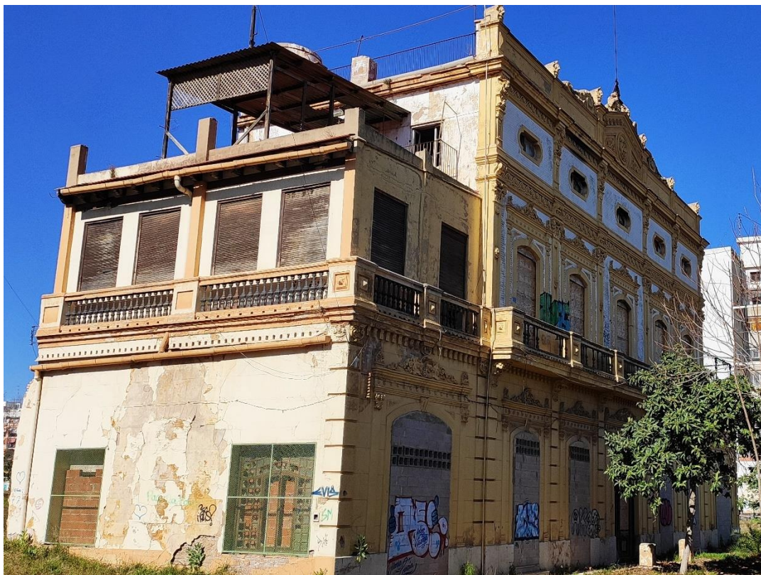
Foto 7. Vista sur del edificio