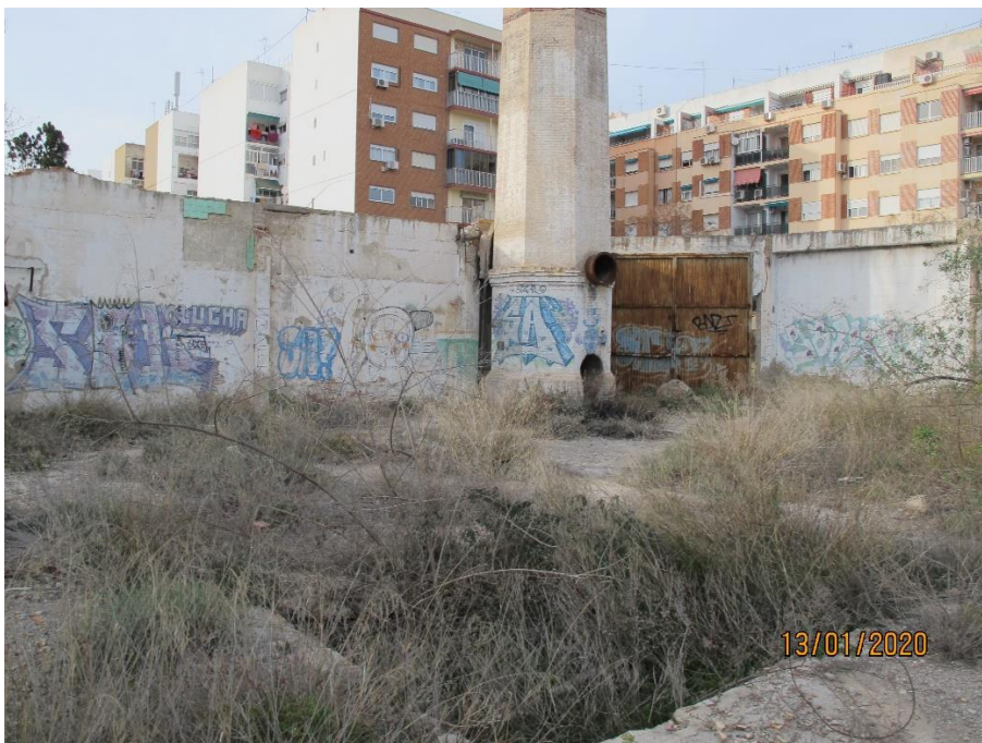
Foto 2. Localización chimenea.