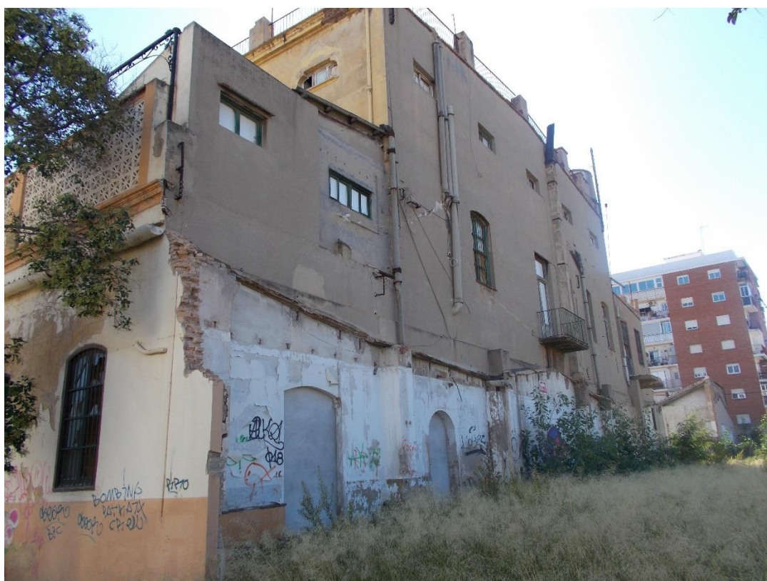
Foto 8. Vista oeste parte trasera del edificio