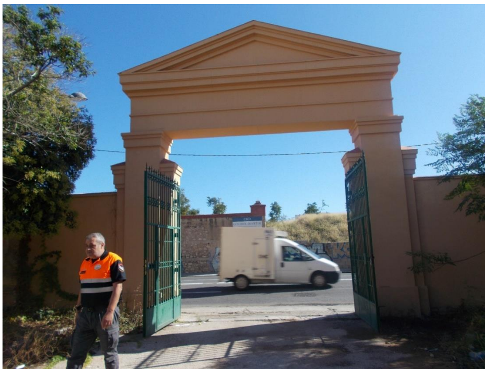
Foto 11. Antiguo acceso principal del Cuartel de Artillería.