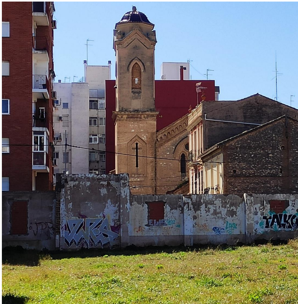
Foto 18. Vista de la Iglesia del Cristo de la providencia, desde el interior de la actuación.