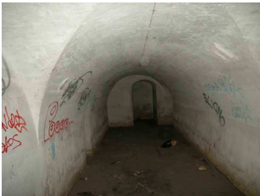
Foto 16. Vista del nivel inferior del refugio antiaéreo.