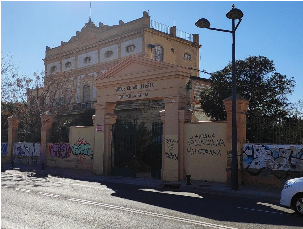
Foto 5. Entrada principal y fachada edificio