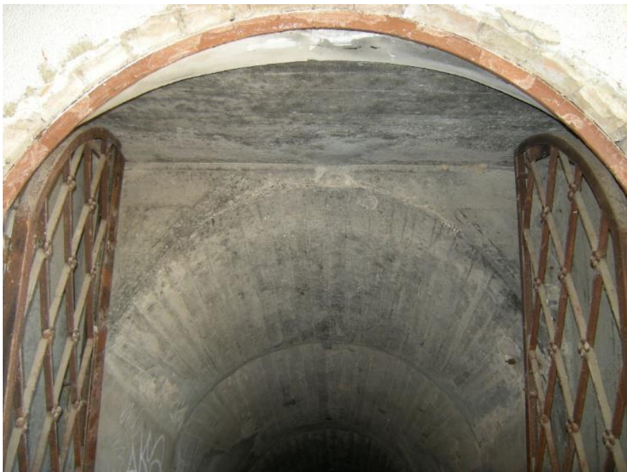
Foto 14. Puerta de acceso al refugio antiaéreo.

El Proyecto de derribo contempla la conservación del refugio antiaéreo, edificio protegido situado dentro de la actuación. Consta de dos entradas que habrá que respetar para dejar acceso libre a la edificación subterránea.