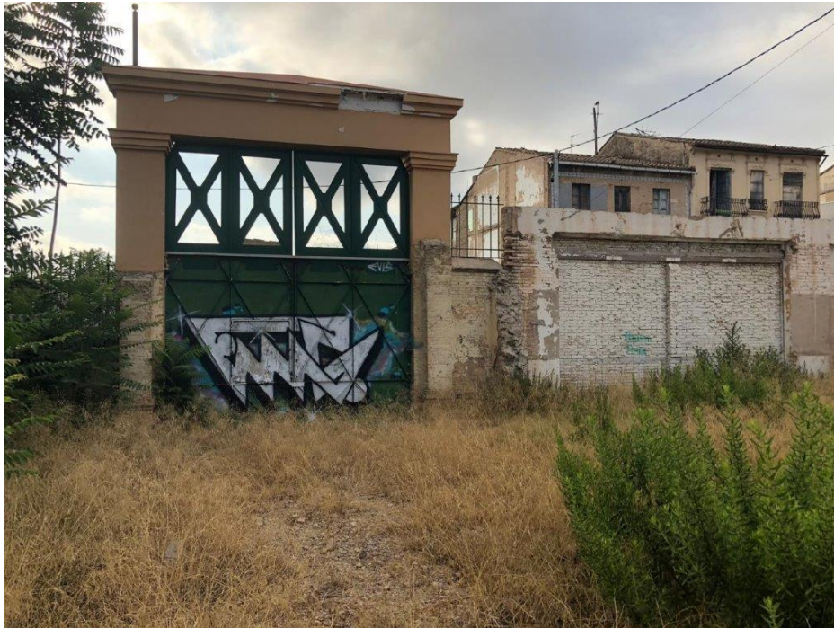
Foto 13. Puerta secundaria del muro.