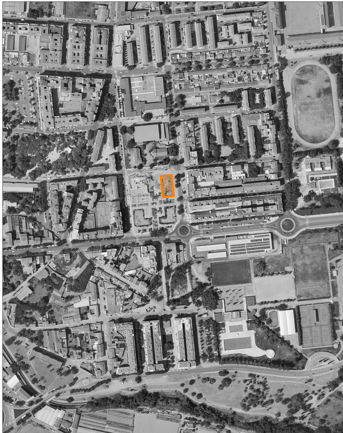
EMPLAZAMIENTO Esc: 1/4.000