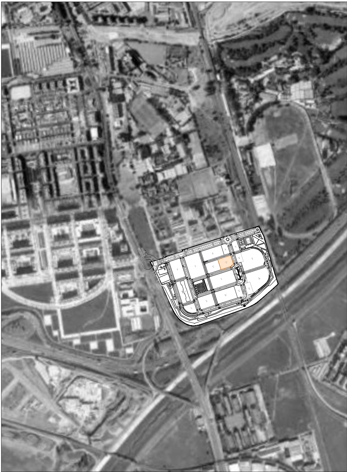
EMPLAZAMIENTO Esc: 1/10.000